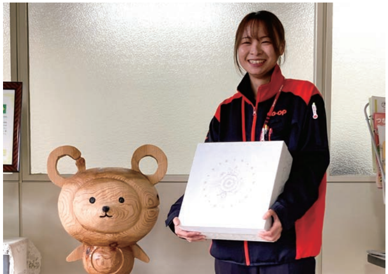
「ここ」の隣ではじめましてBOX持つ流さん